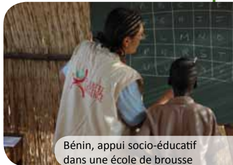
Bénin, appui socio-éducatif dans une école de brousse

Celui-ci se matérialise à travers la signature d'un accord-cadre dans lequel est défini le projet de partenariat, le nombre de salariés dont la mission sera financée, les conditions et modalités de participation aux missions ainsi que le montant de la participation financière de l'entreprise.