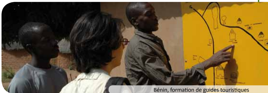
Bénin, formation de guides touristiques

L'organisation partenaire locale Accueille et accompagne le (la) salarié(e) durant sa mission