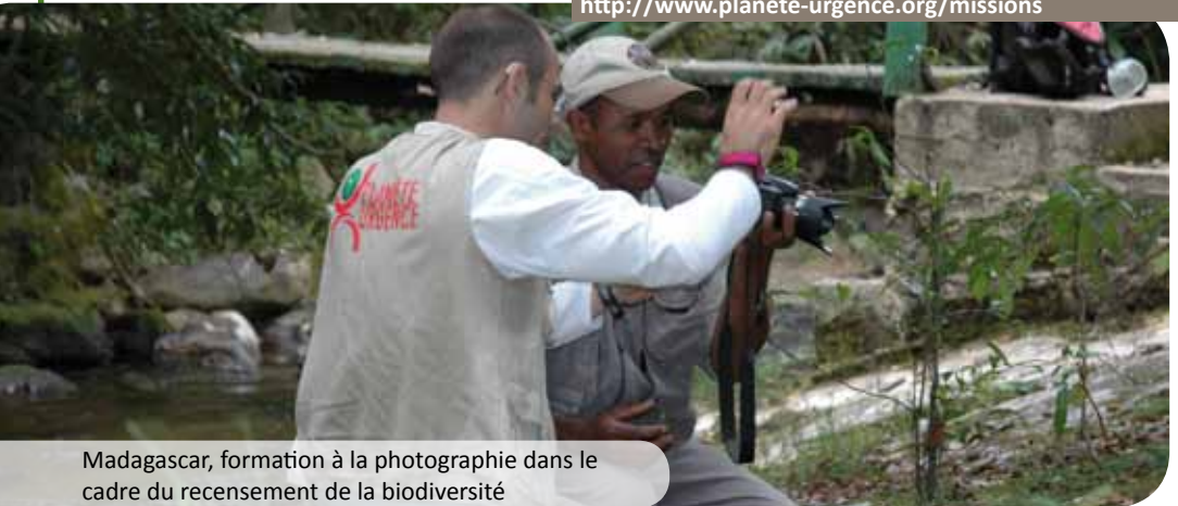
Madagascar, formation à la photographie dans le cadre du recensement de la biodiversité

Pour consulter la liste de nos missions : http://www.planete-urgence.org/missions