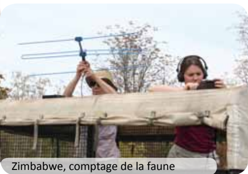
Zimbabwe, comptage de la faune

valeurs généreuses, de développement durable et / ou de RSE au sein de leur future entreprise.