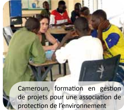
Cameroun, formation en gestion de projets pour une association de protection de l'environnement

Via ses équipes en France et sur place et grâce à son réseau d'interlocuteurs nationaux et internationaux, l'association s'assure des évolutions politiques, institutionnelles et sécuritaires des pays où elle intervient. Elle adapte son dispositif à tout changement ou hypothèse crédible d'évolution d'une situation donnée.