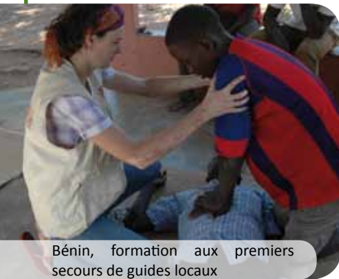
Bénin, formation aux premiers secours de guides locaux

Votre collaborateur est accompagné avant, pendant et après sa mission.