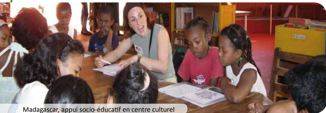
Madagascar, appui socio-éducatif en centre culturel

Planète Urgence favorise les initiatives citoyennes de développement et de protection de l'environnement par le renforcement des savoir-faire et des compétences. Il ne s'agit pas de se substituer aux populations locales mais de renforcer leurs capacités et leur autonomie dans le cadre de leurs propres initiatives et projets : ce sont nos partenaires qui définissent leurs besoins et les objectifs auxquels nous les aidons à répondre.